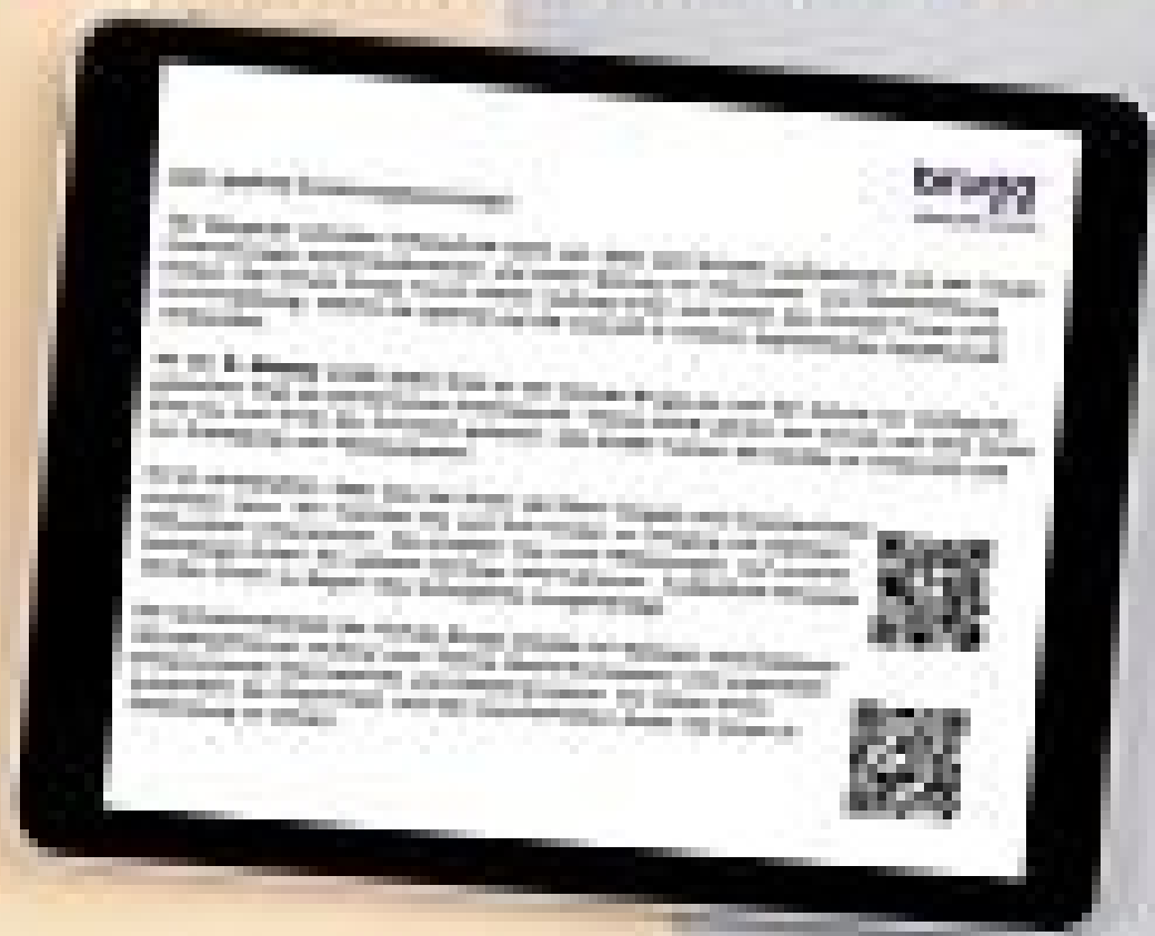
Flyer iPads.pdf [pdf, 719 KB]