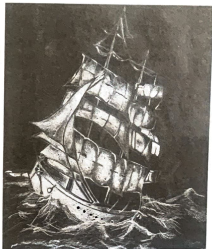
Gleiches Motiv, verschiedene Stilrichtungen: Arbeiten der Bezschüler