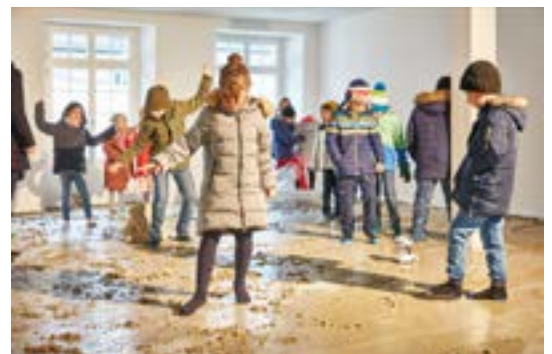
Körperübung in der Rauminstallation von Sarah Burger

Um die häufigen Besuche finanziell möglich zu machen, führen die Lehrpersonen mit vorgestalteten Programmen nach und nach selbständig Sequenzen im Aussenzimmer durch. Einzelne Übungen werden immer wieder angewandt und so zu erprobten Ritualen .