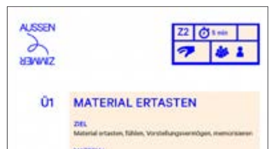
Beispiele der grafischen Umsetzung des Programms