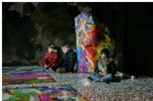
Gedankenreise in der Rauminstallation von Frölicher | Bietenhader