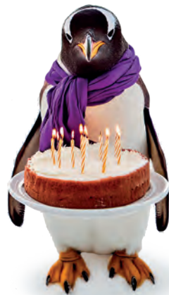
KI generiertes Bild mit Adobe Firefly