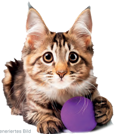
KI generiertes Bild mit Adobe Firefly