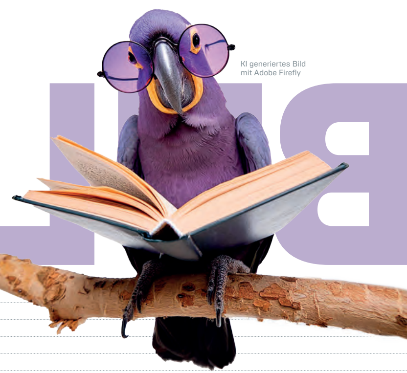
KI generiertes Bild mit Adobe Firefly