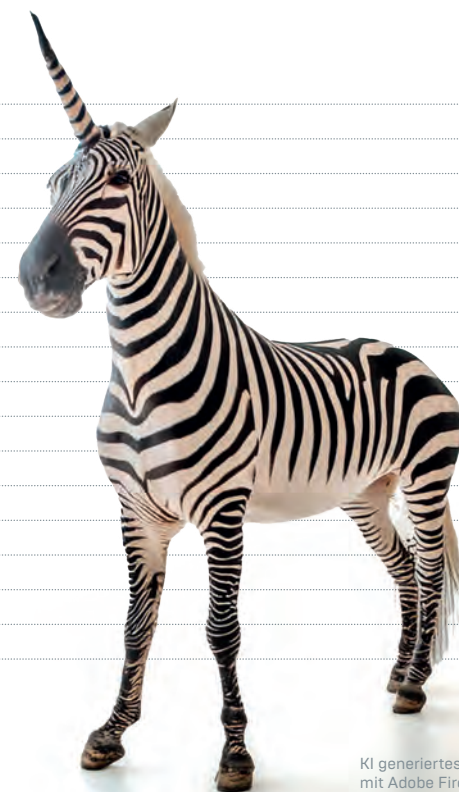
KI generiertes Bild mit Adobe Firefly