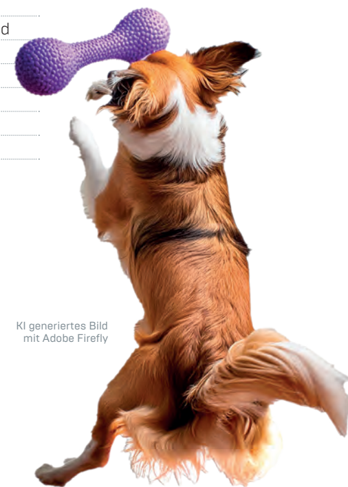
KI generiertes Bild mit Adobe Firefly