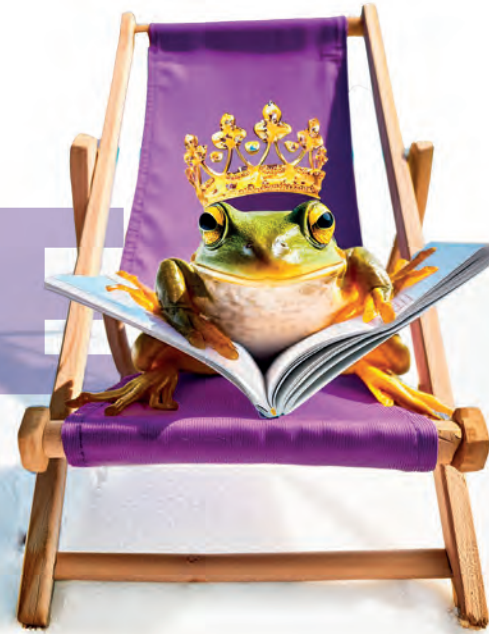
KI generiertes Bild mit Adobe Firefly